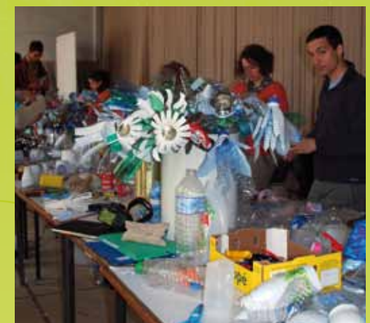
Ateliers de cerfs-volants

Pour construire la Fête dès maintenant, des ateliers de fabrication de cerfs-volants pour tout public permettront aux communes, aux associations locales de se mobiliser et de participer en amont de l'événement, les week-ends des 22-23 et 29-30 mai au château de Jambville, et le jour même de la Fête.